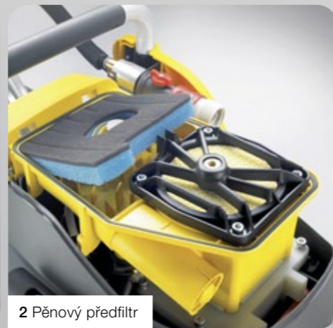
2 Pěnový předfiltr