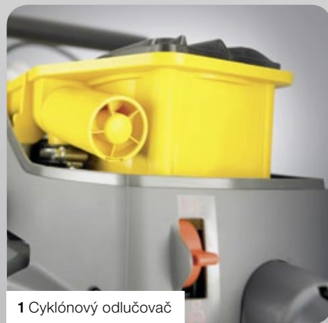
1 Cyklónový odlučovač

3stupňový vzduchový systém: Nasátý vzduch jde nejprve přes cyklónový odlučovač, kde dojde k odstranění velké části nečistot. Pak následuje pěnový předfiltr. Až na závěr prochází předčištěný vzduch hlavním filtrem. Tento způsob filtrace zvyšuje životnost vzduchového filtru mnohonásobně. Navíc dochází pouze k malým ztrátám tlaku, což vede k trvale vysokému výkonu.