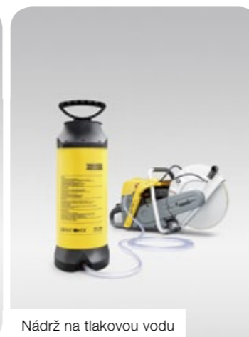
Nádrž na tlakovou vodu

Špička v přesnosti. Vodící kladka řady BTS s integrovanou nádrží na vodu a s přípojkou na vodu je ideální pro zemní práce menšího rozsahu: Pohodlně s ní lze dělat krátké řezy do asfaltu nebo betonu.