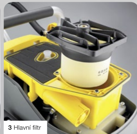
3 Hlavní filtr